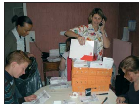
Ouverture du courrier, tri, analyse des résultats, réponse aux courriers et aux appels téléphoniques, toute l'équipe se mobilise avec enthousiasme.

La solution à ce problème de surpopulation, la plus humaine et la plus bénéfique pour la société, c'est d'engager un vrai plan de construction de prisons. Le coût de cette mesure sera largement compensé par la baisse du nombre de victimes et le retour à la sécurité. □