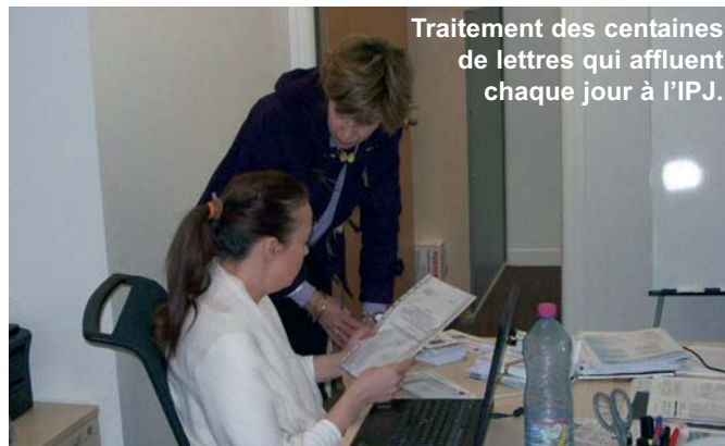
Traitement des centaines de lettres qui affluent chaque jour à l'IPJ.

Inutile de dire que d'énormes sacs de courrier se sont mis à affluer au siège de l'association. Le secrétariat de l'Institut pour la Justice s'est retrouvé submergé par des dizaines de milliers de lettres. Un phénomène sans doute jamais observé en France, et qui témoigne de la profonde inquiétude de millions de Français face au fonctionnement de la Justice.