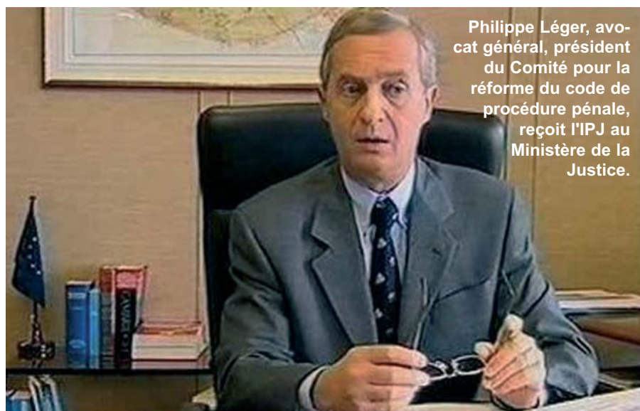
Philippe Léger, avocat général, président du Comité pour la réforme du code de procédure pénale, reçoit l'IPJ au Ministère de la Justice.

Comment obtenir que les criminels fassent vraiment la peine à laquelle ils ont été condamnés ?